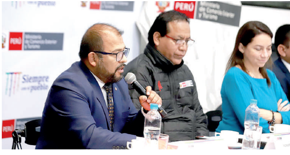
•AREQUIPA DESTACA como destino turístico.

El ingreso de la Ciudad Blanca a la lista, ha sido fruto del trabajo conjunto entre el Mincetur y el Gobierno Regional de