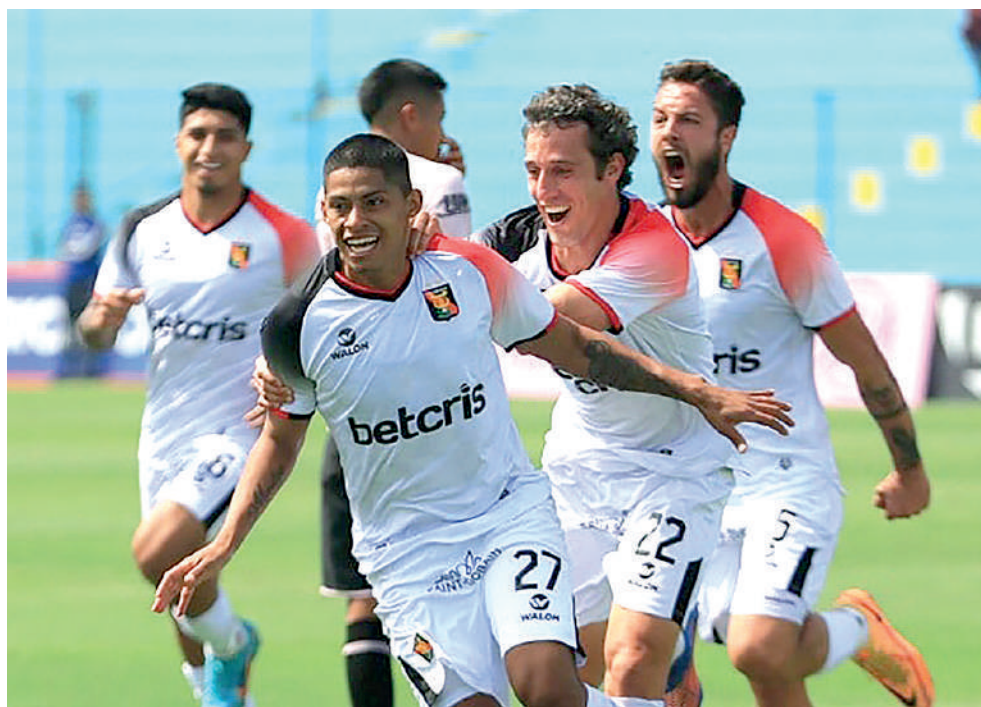
•MELGAR RUMBO a coronarse campeón del Apertura.

Sporting Cristal demostró que quiere luchar hasta el final sus opciones de quedarse con el primer certamen al vencer 2-0 al