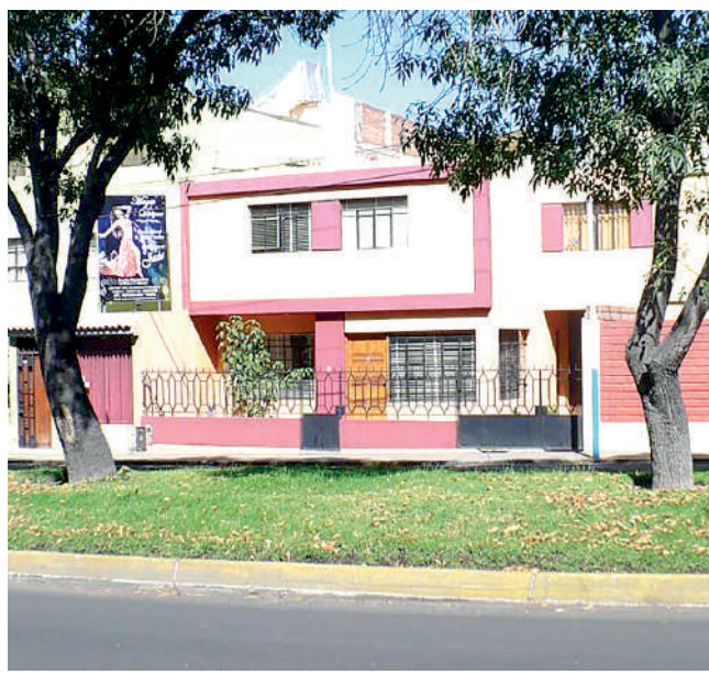
• GRA TRANSFIRIÓ recursos para obras en Yanahura.