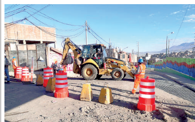
• OBRAS en el distrito de Paucarpata.

En ese sentido, la Municipalidad Distrital de Paucarpata pide la comprensión y colaboración de los conductores, ya que esta obra beneficiará a todos los vecinos de Nueva Alborada y sectores aledaños con una vía completamente renovada, muros de concreto, sardinell, mantenimiento de buzones y drenajes existentes, con una inversión de más de 1,4 millones de soles.