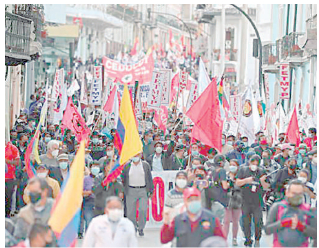
● CONVULSIÓN SOCIAL en Ecuador.

"Estamos atendiendo las legítimas demandas ciudadanas", ha planteado, por lo que lamentó que, pese a estas concesiones, la respuesta sea más violencia y nuevas amenazas de atacar a Quito.