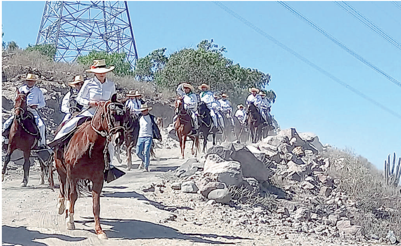
• CABALGATA por rutas socabayinas.

El fin de semana un grupo de chalanos cabalgaron por rutas naturales de Socabaya, con el propósito de promover el turismo.