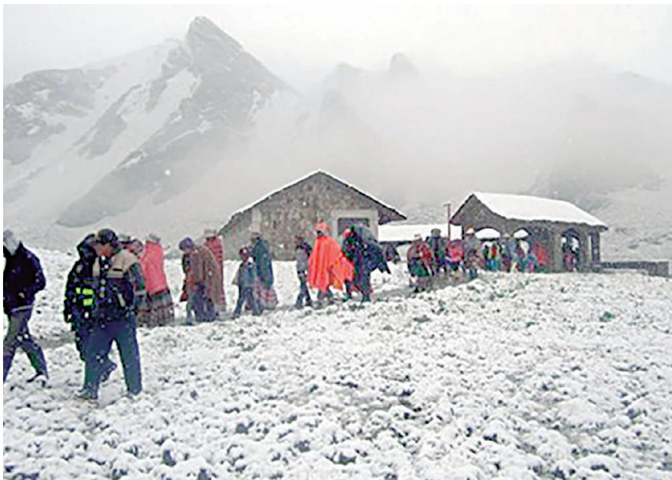
● INTENSO FRÍO se registra en la región.