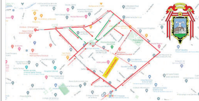
• CAMBIO de rutas.

De esta manera se ratifica el compromiso de la primera autoridad edil con las obras de impacto Regional en el distrito, que no solo beneficiarán a Yanahuara si no a todos los distritos vecinos como Cerro Colorado, Sachaca, Cayma, Miraflores, Tiabaya, Yura, ya que estas obras son de impacto regional que benefician al desarrollo de Arequipa.