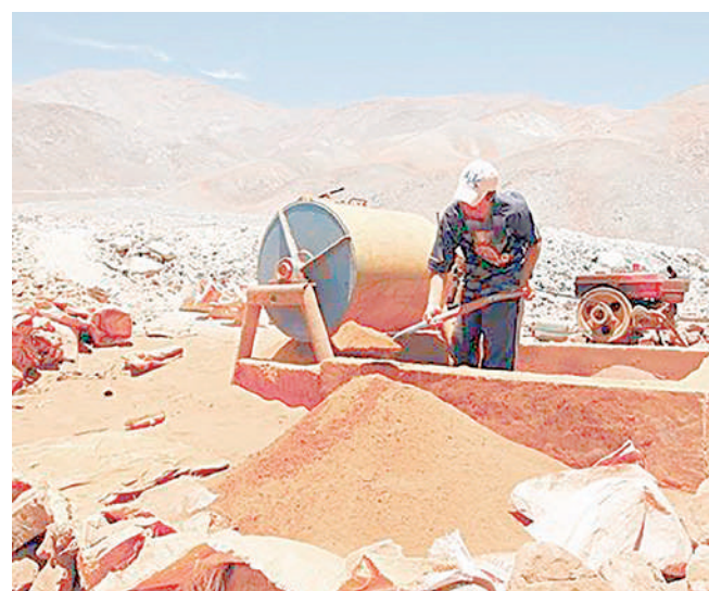
● MINERIA INFORMAL genera violencia en Ático.

Por lo pronto, el Senamhi mantendrá avisos meteorológicos preventivos (nivel amarillo) para alertar a las autoridades a impulsar acciones de prevención. Ticona sostuvo que la comunicación se mantendrá con las gerencias regionales de Salud y Agricultura ante “posibles daños que pueda generar esta ola de frío que se prolonga desde hace varios días”.