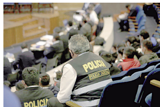
● PNP INVESTIGA HURTO DE MAQUINARIA de Ático.