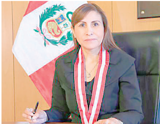
● PATRICIA BENAVIDEZ, nueva Fiscal de la Nación.