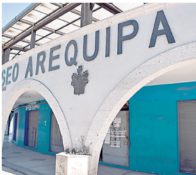
● EL COLISEO AREQUIPA será escenario de la sesión de la PCM.