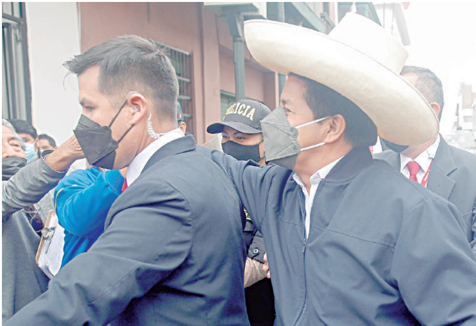
● PEDRO CASTILLO, presidente del Perú.

La Primera Sala Constitucional de Lima confirmó el fallo que declaró improcedente la demanda de habeas corpus que presentó el presidente Pedro Castillo para anular el acuerdo del pasado 28 de febrero, donde se admite a trámite una denuncia constitucional contra el mandatario por presunta traición a la patria.