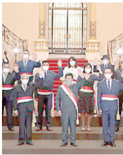
MINISTROS DE ESTADO