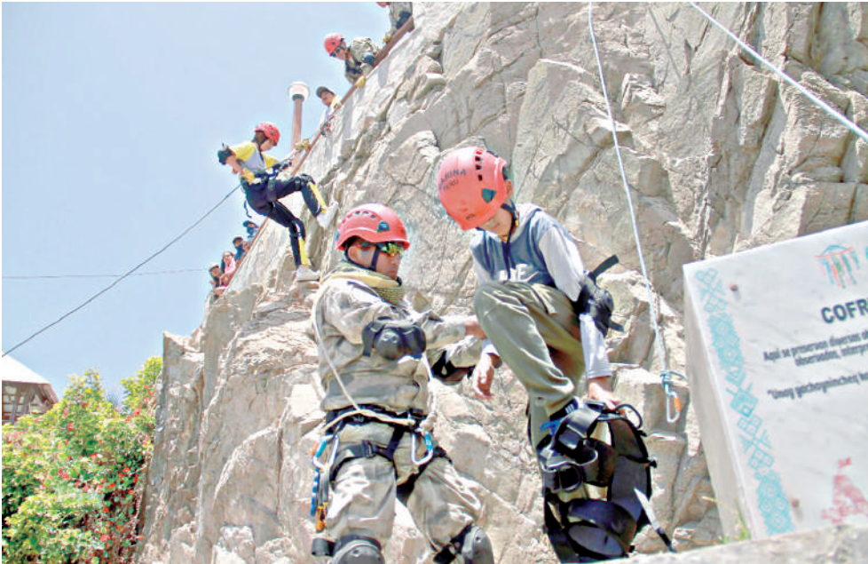
DEPORTISTAS DEMOSTRARON FUERZA Y DESTREZA en competencia realizada en Mollendo.

Precisó que en el Festival Gastronómico de Comedores Populares, realizado en el malecón Ratti, participaron 16 grupos y entrega-