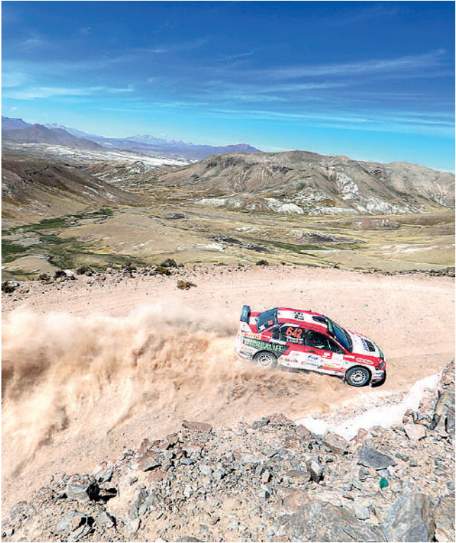
•LA CARRERA SERÁ Lima- Huancayo- Ayacucho- Cusco- Puno- Arequipa- Cusco.

Esta será una oportunidad imperdible para los aficionados al rally para conocer de cerca a los referentes del automovilismo y a talentosos pilotos del interior del país, que representan a más de la mitad de los binomios participantes. La competencia constará de seis etapas que se desarrollarán entre: Lima- Huancayo- Ayacucho- Cusco- Puno- Arequipa- Cusco.