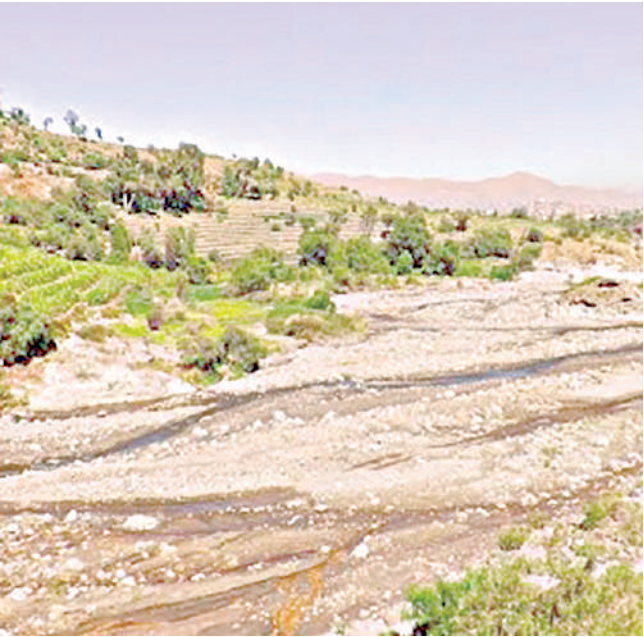
● INICIAN TRABAJOS DE PREVENCIÓN contra lluvias en Socabaya.

REGULARIZARÁN ESQUEMAS DE VACUNACIÓN En otro momento, la encargada del área de Inmunizaciones también refirió que han coordinado con el personal de salud para que la vacuna contra el covid-19 se aplique junto al esquema regular de vacunación de los niños menores de 5 años; puesto que este se vio alterado durante la pandemia. “Por ejemplo, nosotros le ponemos a los dos meses y a los cuatro meses una vacuna contra la poliomielitis que ahorita estamos preocupados de mejorar las coberturas. En este caso, a los dos, a los cuatro y a los seis meses, el niño tendría la tercera dosis que le da protección. Nosotros estamos midiendo con esa tercera dosis y quisiéramos que suba el tema de vacunación y que no se quede el niño sin vacunar”, dijo.