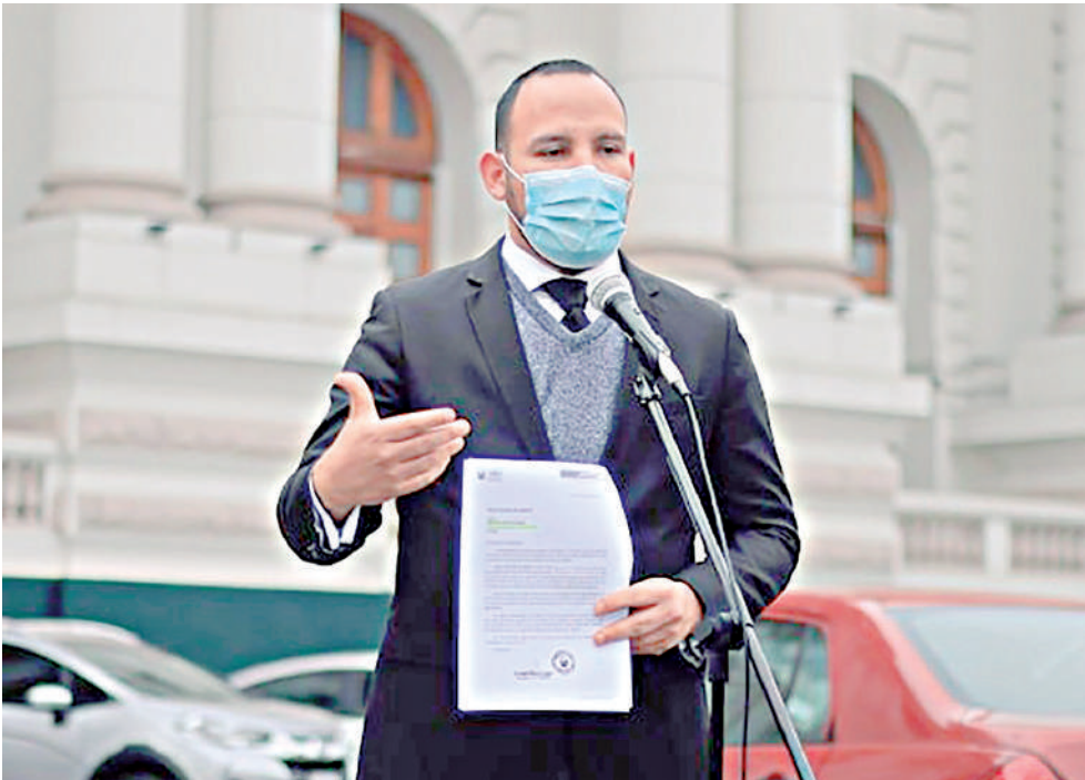
● CONGRESISTA Alejandro Muñante.

Para Alejandro Muñante, existe todo un transfondo político en esta moción de censura para destituirlo de la