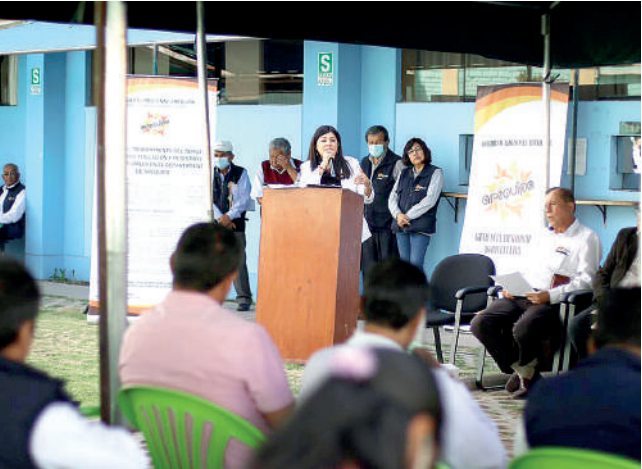
• INVERTIRÁN 22 MILLONES de soles en sector agrario.