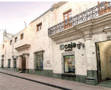
• CAJA AREQUIPA reafirma su liderazgo.

Agregó que es “un gran reto que se nos viene, poder continuar con la coherencia de nuestros mensajes y el actuar diario en las más de 190 oficinas que tenemos a nivel nacional, donde celebramos a quienes apuestan por un mañana mejor”.