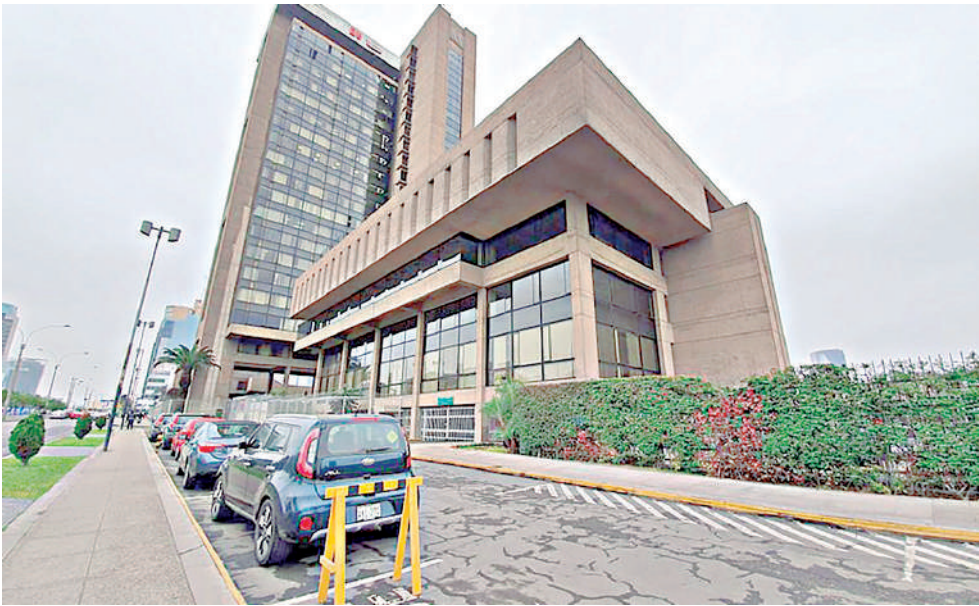
● FUNCIONARIOS DE PETROPERÚ implicados en mafia de Castillo.