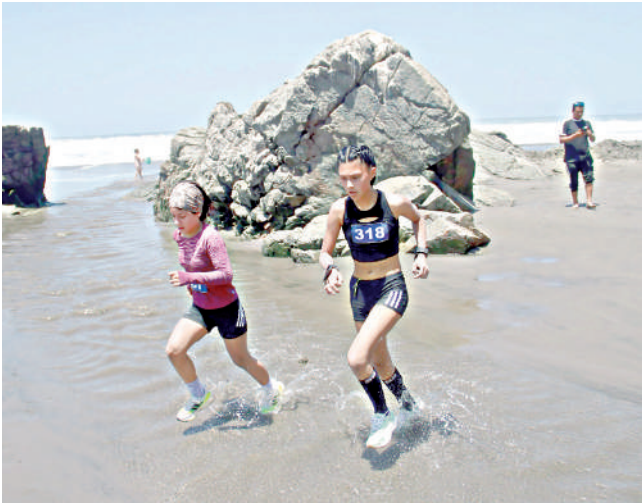
NIÑOS Y ADOLESCENTES, los competidores más entusiastas.

Quinto Lugar: Los Olivos del Puerto - Mollendo con Arroz de mariscos