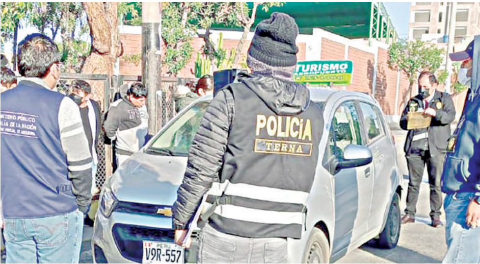
● INSEGURIDAD EN CERRO COLORADO es imparable.

Por: JOSÉ COLQUE Agentes del Escuadrón Verde – Grupo TERNA lograron la detención de tres varones que presuntamente conformaban la banda “Los duros de Ciudad Blanca” dedicados a robar viviendas. La Policía informó que los sujetos estaban deambulando por la avenida Aeropuerto, aparentemente, para ingresar a un domicilio. La intervención se registró cerca de las 06:00 horas en la avenida Aeropuerto del distri-