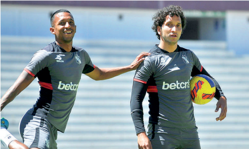
•MELGAR NO DEBE PERDER punto alguno si quiere el título nacional.

LLEGÓ EL DÍA. LOS PUNTOS EN DISPUTA VALEN ORO PARA UNIVERSITARIO Y MELGAR , es por ello lo trascendental del compromiso que sacará “chispas” hoy desde las 15:45 horas en el estadio Monumental de Ate, donde se espera un arbitraje imparcial, y que gane el mejor. El partido corresponde a la fecha 16 del Torneo Clausura.