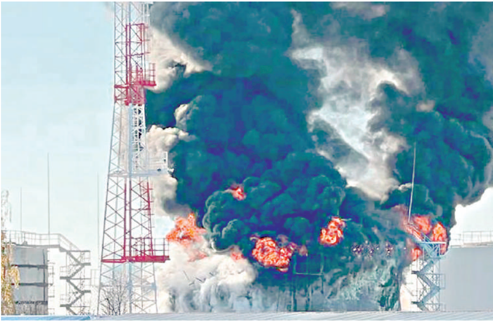
● ATENTADO TERRORISTA EN BÉLGOROD, región fronteriza con Ucrania.

Al menos once personas murieron y quince resultaron heridas el sábado en un ataque “terrorista” contra un terreno de entrenamiento militar ruso en la región de Bélgorod, fronteriza con Ucrania, informó el ministerio ruso de Defensa.