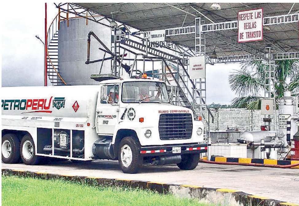
• EL DIÉSEL SE VENDE casi 3 veces más que la gasolina.

En las ciudades del norte del país, Petroperú atiende casi la totalidad de la demanda de combustibles considerando que tiene su refinería en Talara, precisamente en esta parte del país se ha evidenciado una mayor restricción de combustibles.