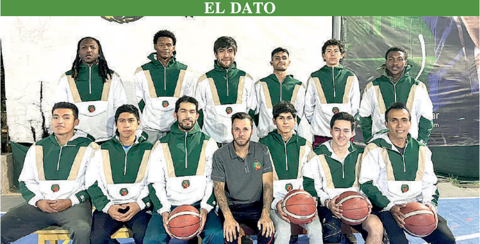
LOS OSOS DE LA SALLE DE AREQUIPA son los campeones de la primera edición, esperan lograr nuevamente el campeonato.