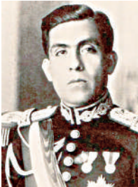
MIGUEL SANCHEZ CERRO

Entretanto, lo que hacían los conspiradores era reunirse, especular sobre un golpe de Estado que se concretó el año 30 cuando efectivamente y teniendo por sede esta ciudad se secundó el movimiento de Sánchez Cerro en Lima y aquí hubo una rebelión similar.