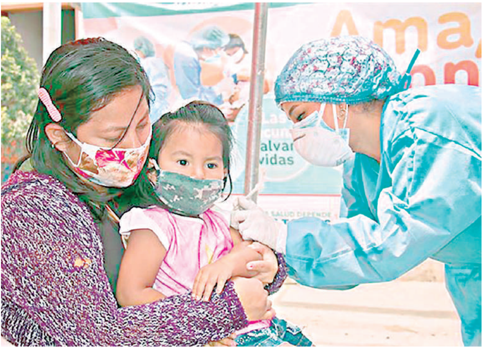
● TODO LISTO PARA VACUNAR A MENORES de 5 años contra la COVID.

A simismo, detalló que otro factor resaltante en el ‘calmado proceso de inoculación’, es el tiempo de la disponibilidad y duración de las dosis del laboratorio Moderna. En un principio, el tiempo promedio de duración de las vacunas era de aproximadamente tres meses, sin embargo, este nuevo lote de vacunas tiene un estimado de entre 8 y 9 meses. “El tiempo de manejo es suficiente para hacerlo de forma ordenada”, agregó.