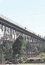
PUENTE DE FIERRO

La mujer fue objeto de llamada de atención y Carbajal puesto a disposición del juez instructor por el intento de matarse.