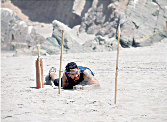
ESFUERZO Y RESISTENCIA en carrera con obstáculos realizada en playas de Mollendo.

FOMENTAN EL DEPORTE SANO, el turismo y el circuito de playas en Islay.