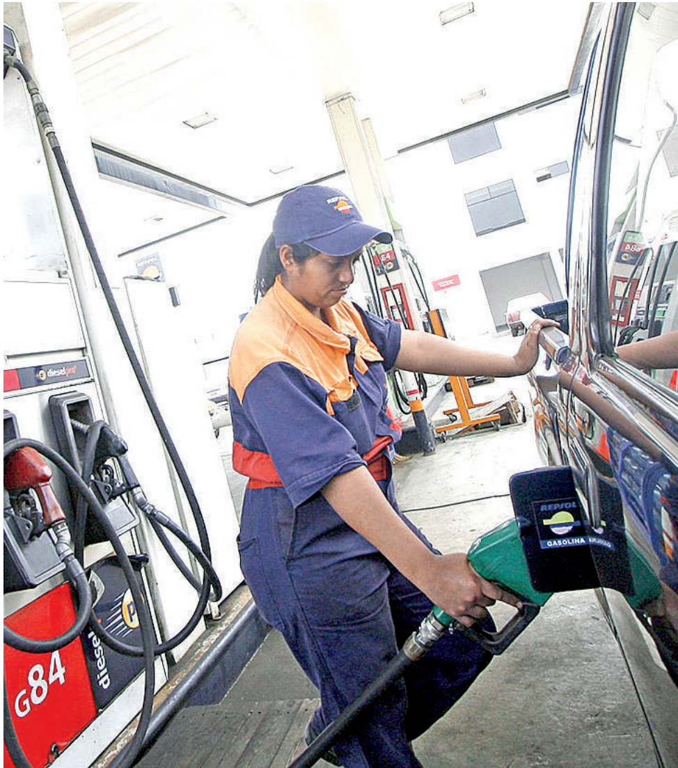
• PREVEN ESCASEZ y alza de combustibles.

Según Agesp, la menor disponibilidad del combustible se explica porque los distribuidores mayoristas de combustibles no están atendiendo los pedidos de acuerdo a lo solicitado, incluso