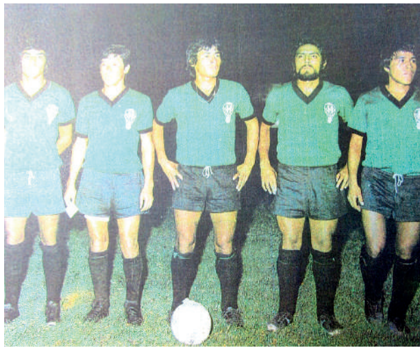
• UN DÍA COMO HOY Sportivo Huracán logró el título de campeón de la Copa Perú.

El domingo 11 de febrero, el cuadro arequipeño tuvo un traspie y pierden 1-0 ante Cienciano del Cusco. Mientras que el jueves 15 Huracán hace historia tras derrotar 2-0 a Sider-