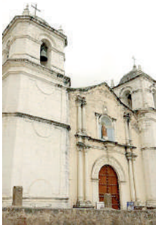
IGLESIA DE CABANCONDE

La cruz que coronaba la iglesia matriz de Cabanconde cayó a tierra herida por un rayo en un día de tormenta de la última semana. Ahora el alcalde quiere que alguien la reponga, pero con un pararrayos.