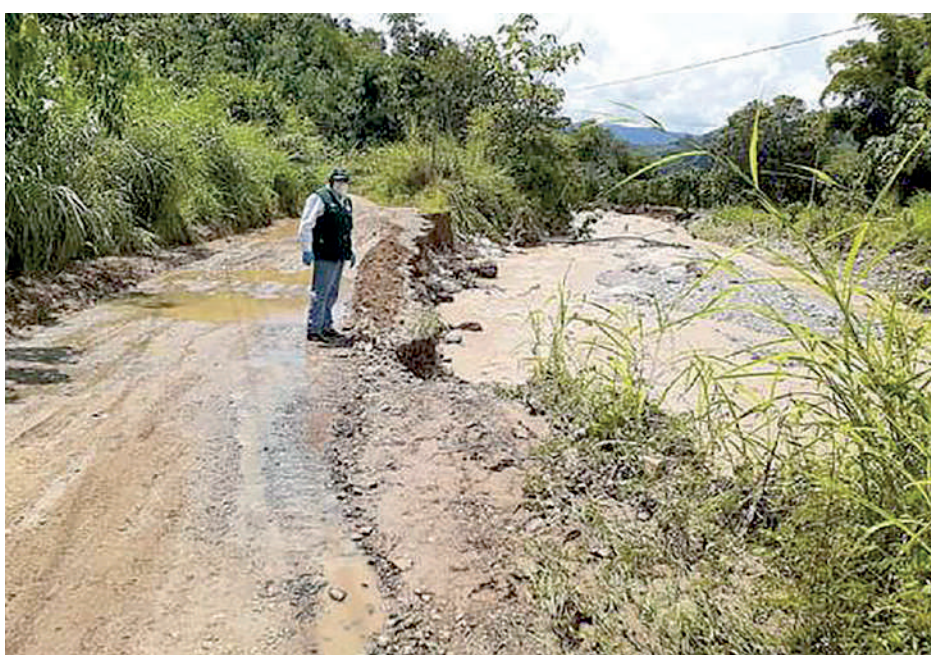
● LLUVIAS OCASIONAN severos daños en la provincia de Castilla.

"He solicitado en sesión de Consejo que se declare en emergencia, se ha pasado la relación y ojalá seamos atendidos por el Gobierno central, son ellos que deben declarar en emergencia para poder utilizar la meta que corresponde para esta atención", dijo.