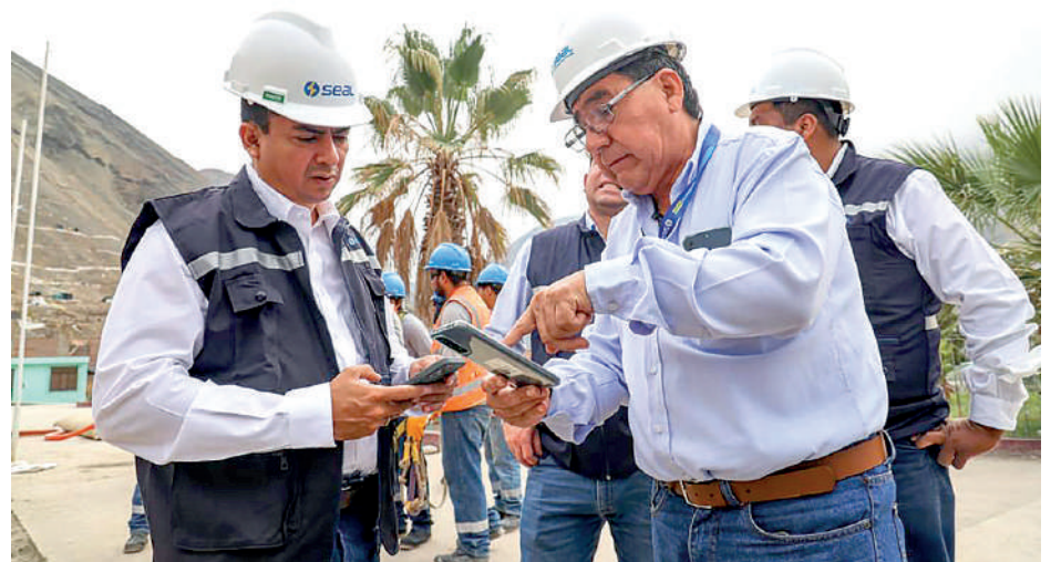
• FUNCIONARIOS DE SEAL supervisan los trabajos que realizan en la zona de la desgracia.