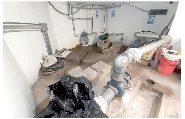
● LA HUMEDAD Y EL SALITRE han invadido el cuarto del motor de la pileta.

Recuperar la salud del Tuturutu depende de la elaboración de un expediente técnico que considere la contratación de un especialista y eso aún está en su etapa inicial.