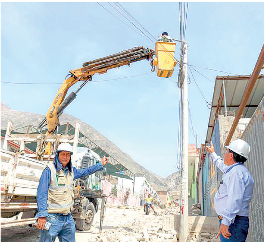
• RESTABLECEN el servicio en la zona afectada por el huaico.