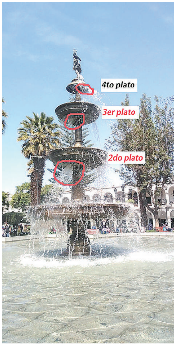
● LA PILETA de la Plaza Mayor requiere urgente refacción.

El restaurador dijo que la fuente no es una sola estructura por el contrario está formada por piezas de piedra cada una está unida a otra con un material especial que se ha ido desgastando, por eso se ven los delgados hilos de agua que corren por las veredas de la plaza o se