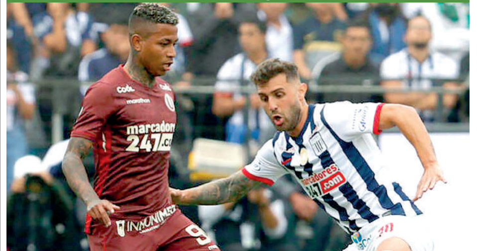
LOS "CREMAS" buscarán recuperarse tras caer 1 - 0 ante Unión Comercio.