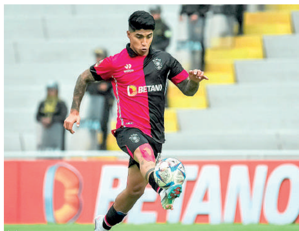
• EL PLANTEL "rojinegro" espera sumar este viernes ante Cristal.