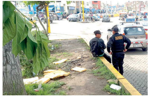
• EMPADRONARÁN a extranjeros que vivan en la ciudad.