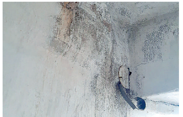
● LAS PAREDES del cuarto de máquinas evidencian filtraciones de agua.

nes está unido al suelo por una fuerte estructura de metal imagínese la fuerza que han utilizado para arrancarlo o seguramente lo han usado para sentarse como lo hacen con las cadenas que circundan la pileta.