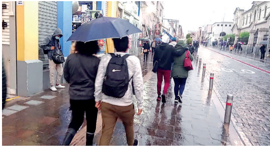
• LLUVIA ARRUINÓ festejos del día del amor y la amistad.

La tarde de ayer, cientos de ciudadanos acudieron a diferentes zonas del Cercado para compartir un momento especial, pero se vieron sorprendidos con intensas precipitaciones, las cuales se replicaron en algunas zonas de distritos como Paucarpata, José Luis Bustamante y Rivero, Socabaya, Mariano Melgar.