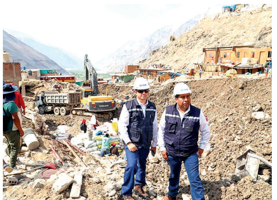
• PERSONAL TÉCNICO acelera su trabajo para cumplir con los usuarios.