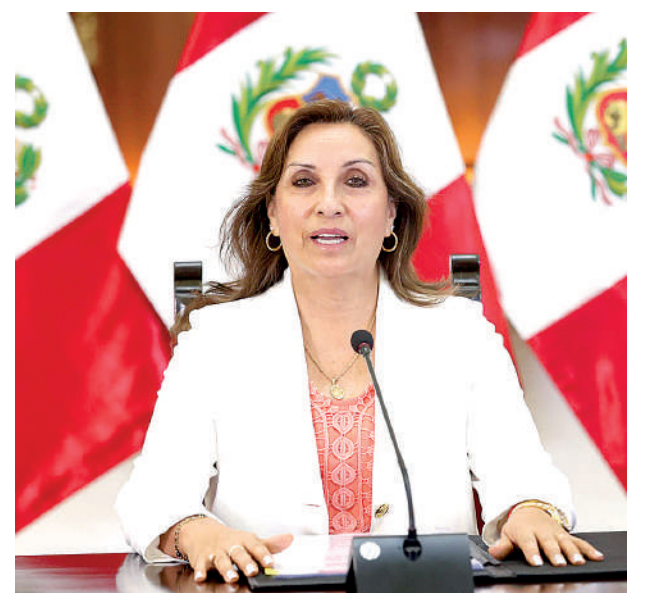
• DINA BOLUARTE, presidenta del Perú.