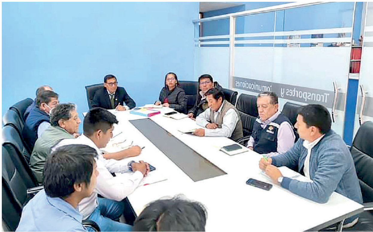
● ROTACIÓN de personal en Transportes.

A la fecha, indicó que se concretó la rotación de los encargados de la Subgeren-