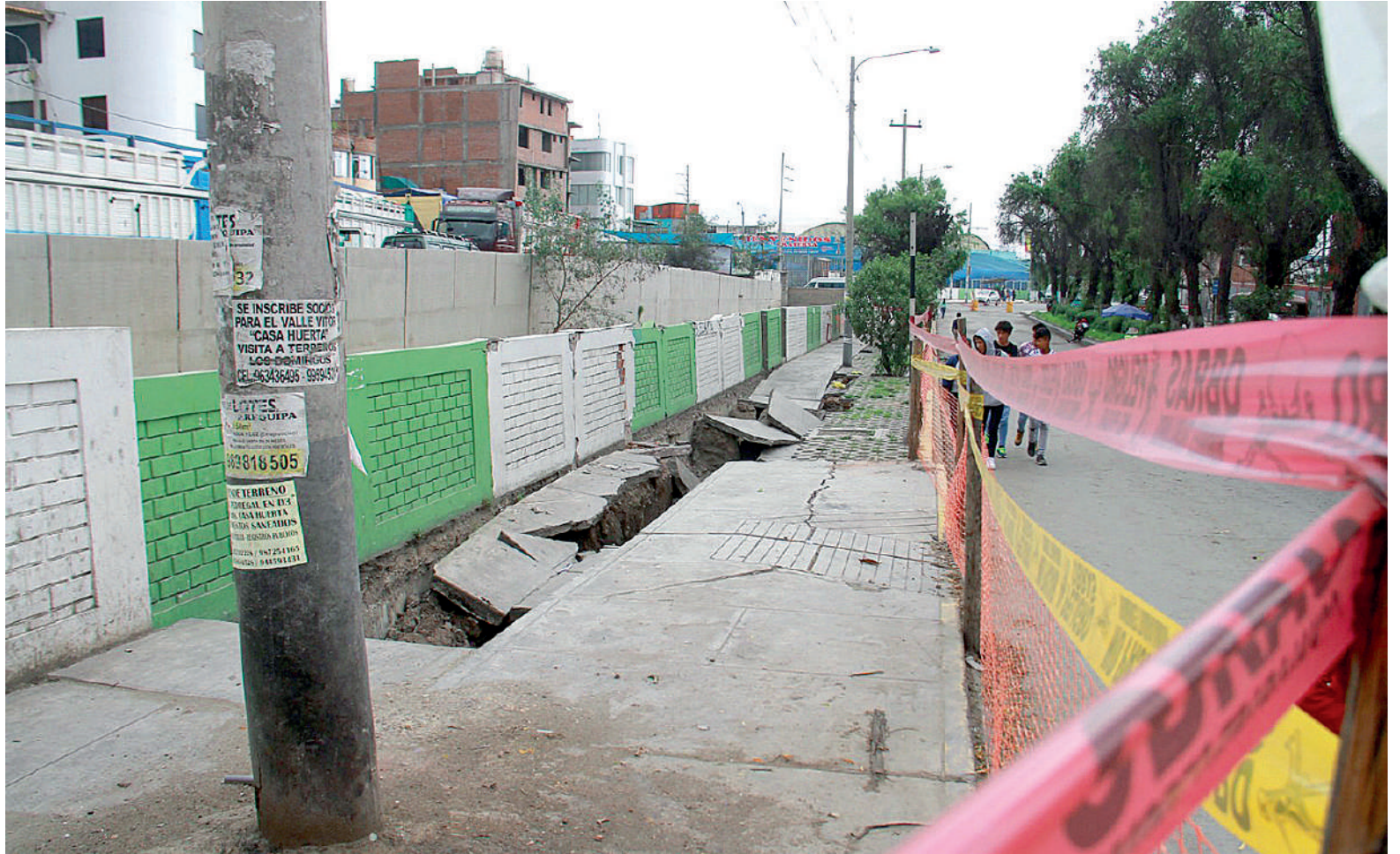
• POSTERGAN REFACCIÓN de muro colapsado en Los Incas.

La intervención en el muro de contención que colapsó en la avenida Los Incas a unos tramos del sector de Gratersa no se realizaría debido a que, según el alcalde provincial Víctor Rivera, existe el riesgo de que los trabajos se vean afectados con las lluvias pronosticadas por el Servicio Nacional de Meteorología e Hidrología (Senamhi).