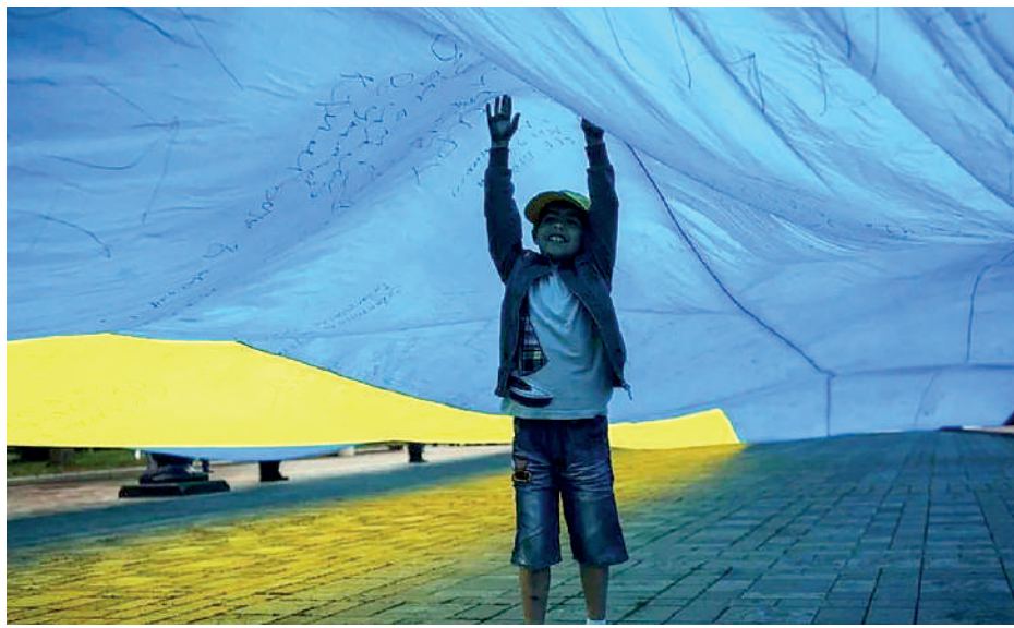
• NIÑOS DE UCRANIA llevan a campos de reeducación y orfanatos.

El experto llamó la atención sobre el alcance geográfico