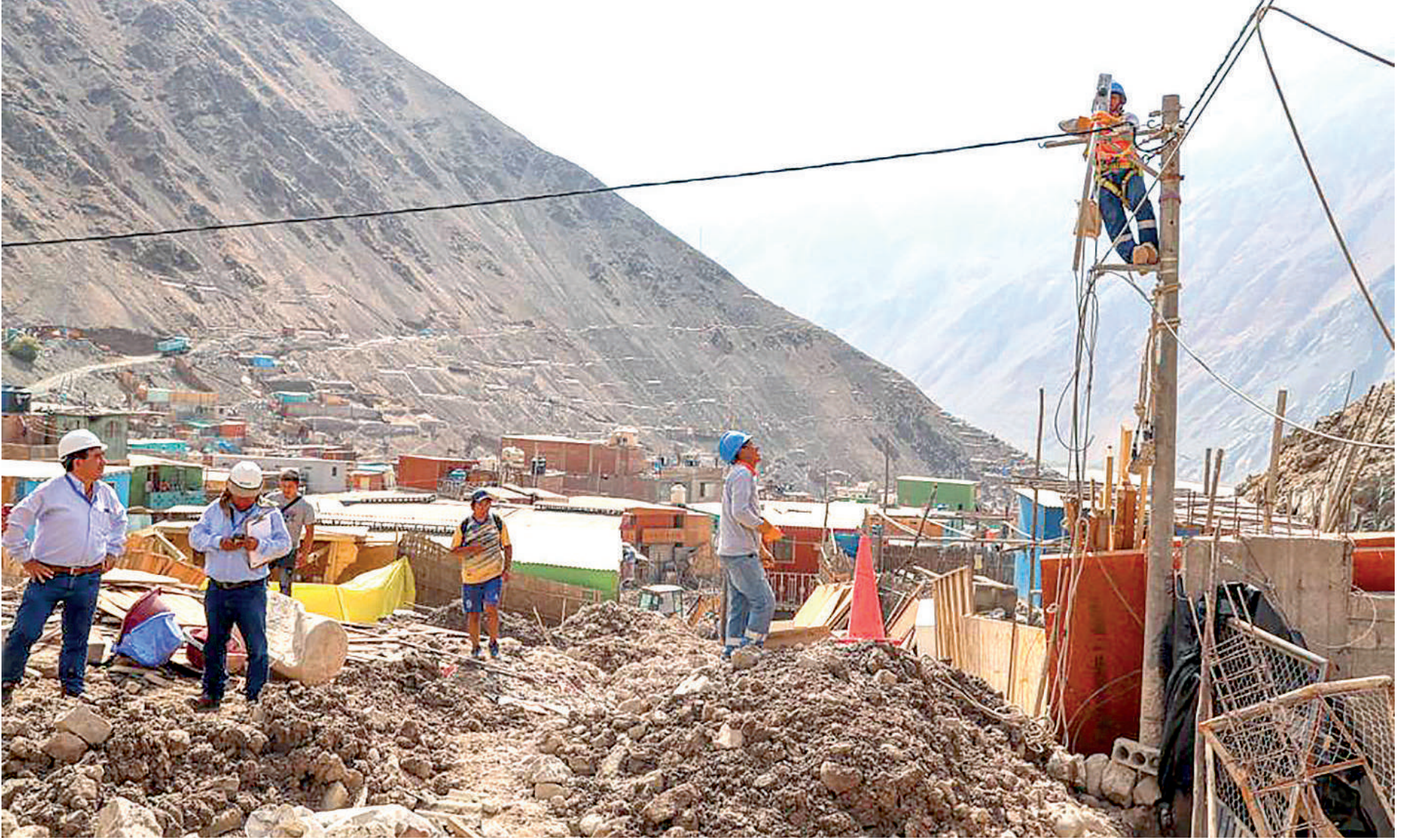
• CUADRILLAS REHABILITAN redes eléctricas afectadas por el huaico.

La empresa eléctrica moviliza siete cuadrillas de distribución e instalación de medidores y el equipo técnico verificó que existen zonas sin acceso y otras redes domiciliarias quedaron enterradas bajo los escombros.