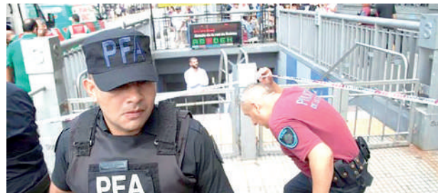
• TITOTEO en Buenos Aires (Argentina).

"Mientras el jefe de Gobierno de la ciudad, Horacio Rodríguez Larreta, afirma que CABA (Ciudad Autónoma de Buenos Aires) es la ciudad más segura de Latinoamérica, nos enfrentamos a estas situaciones en nuestro ámbito de trabajo", lamentó la entidad en un comunicado.