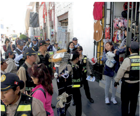
Lucha contra la informalidad.