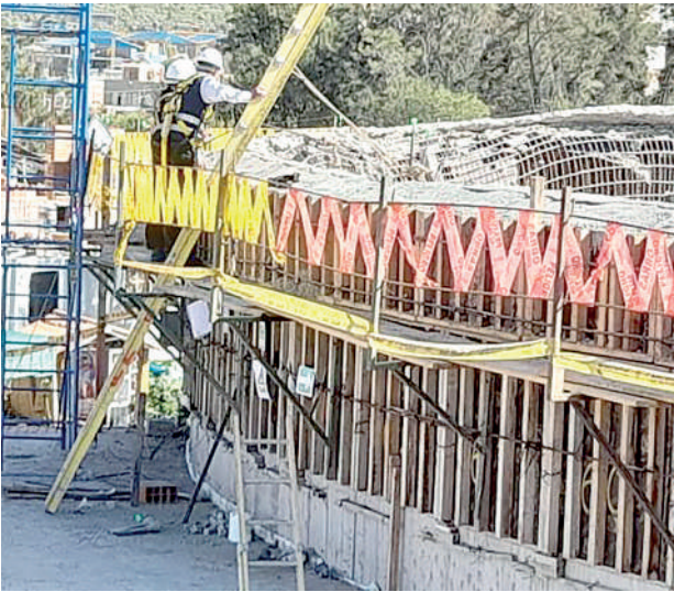
● CONTRATISTA no trabajaba con el total de personal y equipos ofrecidos.

ción de esa acta se consigna el nombre de dos funcionarios de Sedapar, al corroborar su asistencia con el registro de Tamizaje de Covid -19 se verifica que el 3 de julio no ingresó nadie a la obra. Además, ese día fue sábado, no laborable para los funcionarios de Sedapar. “Asimismo, es oportuno