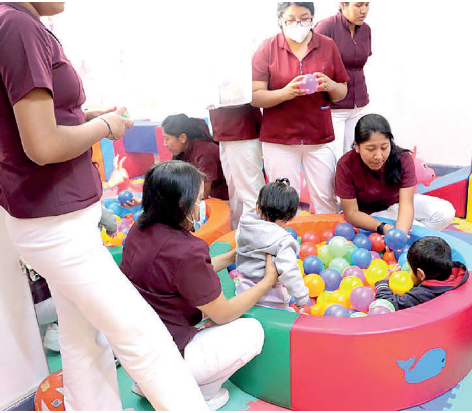
● ROTARY CLUB Arequipa Norte apoya a los más necesitados.