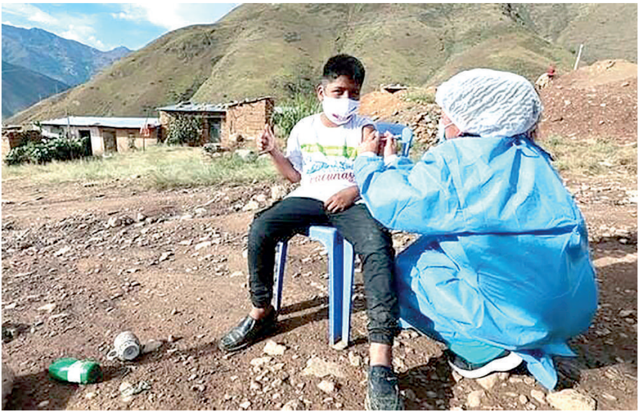
● CAMPAÑA PARA INMUNIZAR a niños empieza hoy hasta el 29 de este mes.

Mediante Resolución Ministerial N° 390-2023, se aprobó el Documento Técnico: “Plan de implementación de inmunizaciones en la Semana de Vacunación en las Américas” que el Ministerio de Salud (Minsa) ejecutará para cerrar brechas de vacunación y con ello prevenir diversas enfermedades inmunoprevenibles entre las familias peruanas. Con el lema “Ponte al día, cada vacuna cuenta”, el Minsa desarrollará desde hoy hasta el 29 de abril la Semana de Vacunación en las Américas con diversas actividades en Lima, Callao y regiones. Esta actividad, impulsada por la Organización Panamericana de la Salud (OPS), tiene el objetivo de posicionar la vacunación en la