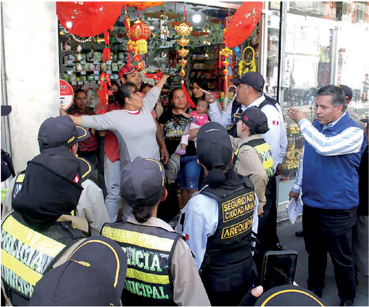
• EN OPERATIVO realizado por la MPA, ambulantes se enfrentaron a policías municipales.

La Municipalidad Provincial de Arequipa inició ayer los operativos de recuperación de espacios públicos en el Cercado de la ciudad. La primera jornada se realizó entre la primera y sexta cuadra de la calle San Juan de Dios, debido a la proliferación de comerciantes ambulantes y artículos que obstaculizaban la vía pública.