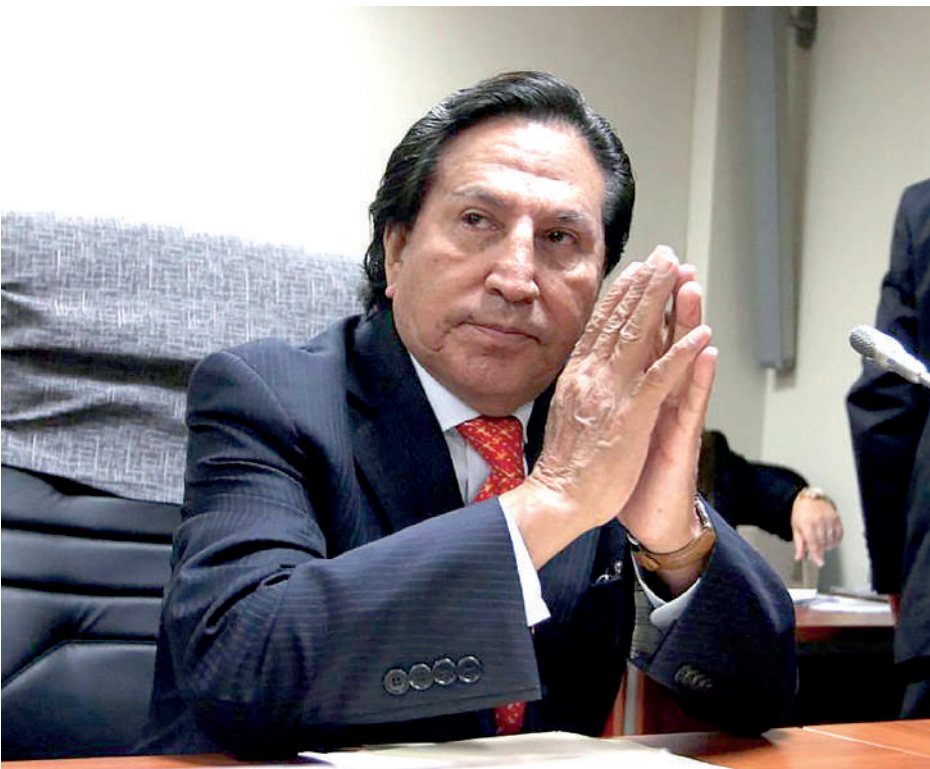
•ALEJANDRO TOLEDO MANRIQUE, acusado de recibir coima por carretera Interoceánica.

El magistrado solicitó 20 años y seis meses de prisión contra el exmandatario.