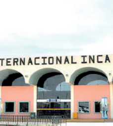
AEROPUERTO DE JULIACA

Los daños sufridos durante las marchas de protesta antigubernamentales dejaron fuera de servicio al aeropuerto Inca Manco Cápac (Juliaca-Puno), se anunció que el 25 de este mes abrirán sus puertas y se iniciarán los servicios aéreos garantizando la seguridad para los pasajeros y para el terminal aéreo.