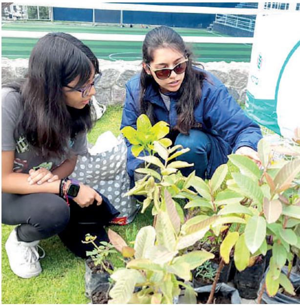
● PROMOVER EL CUIDADO del medioambiente busca la Municipalidad de Yanahuara.

lias en el distrito de Yanahuara con quienes se trabaja en la segregación de fuentes, con el programa EDUCCA esperan incrementar en un 20% el número de familias participantes, además de abarcar al 100% de colegios de la jurisdicción. El programa será promocionado a través de redes sociales, además se dará consejos ambientales para el cuidado del medio ambiente y se incentivará a la población a que participe en todas las campañas emprendidas desde la Municipalidad de Yanahuara.