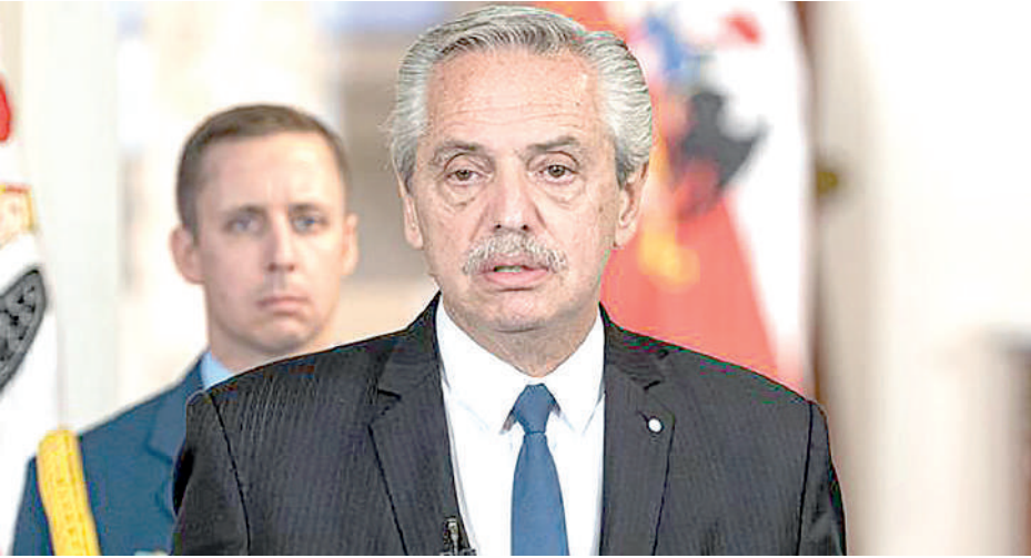
•PRESIDENTE DE ARGENTINA, Alberto Fernández no postulará a la reelección.

tada en una cuestión de regeneración política. «En estos tiempos, más que en otros, necesitamos revitalizarnos», ha hecho saber el mandatario. En el mismo comunicado, Alberto Fernández ha defendido la