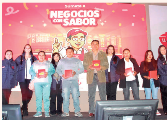
"NEGOCIOS CON SABOR" INCLUYÓ UN DESTACADO PROGRAMA DE INCENTIVOS Y MIX CULTURAL DE DANZAS TRADICIONALES DE PUNO, CUSCO Y AREQUIPA, SIENDO LA CIUDAD BLANCA EL PUNTO DE PARTIDA PARA ESTA GRAN INICIATIVA DE AJINOMOTO.