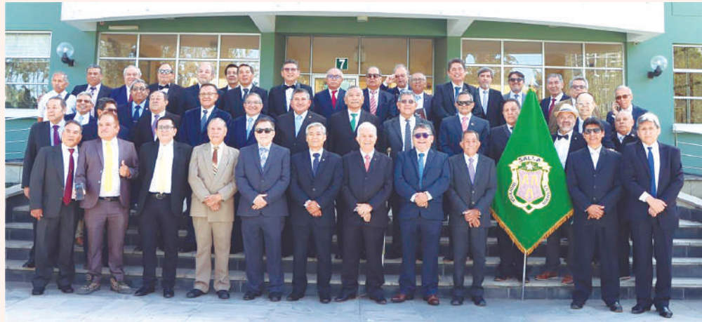
REENCUENTRO DE LA PROMO- CIÓN 75, ALFRE- DO NOBEL DEL COLEGIO DE LA SALLE, CONME- MORANDO SUS BODAS DE ORO